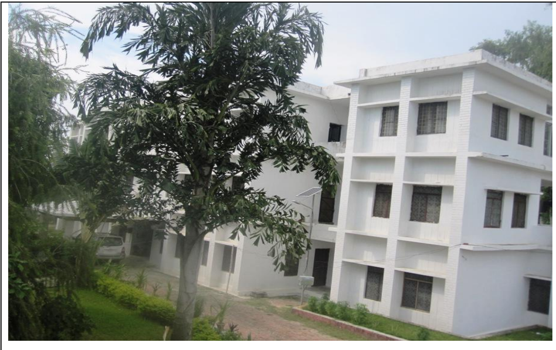
जिल्ला बिकास समिति, बाँकेको कार्यालय