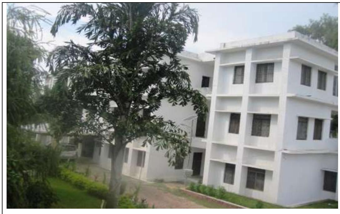
जिल्ला विकास समिति, बाँकेको कार्यालय