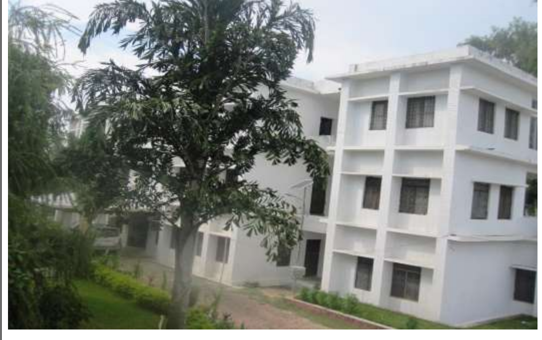
जिल्ला बिकास समिति, बाँकेको कार्यालय